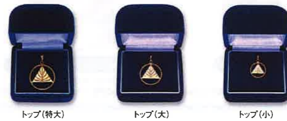
トップ(特大) トップ(大) トップ(小)