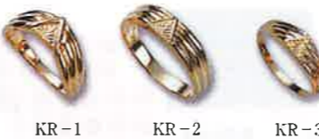
KR-1 KR-2 KR-3